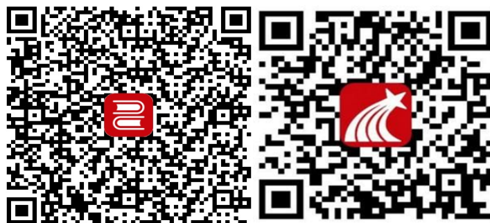
移动图书馆二维码 学习通二维码

1. 扫描以下二维码或者在手机应用商城搜索“移动图书馆”或者“学习通”，下载移动图书馆、学习通 APP. 两种都可以进入我们图书馆的服务页面，任选一种即可。